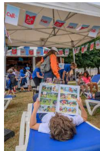
Livrodrome à Saint-Dié-des-Vosges le 12 juillet