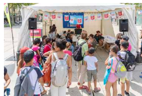
Livrodrome à Saint-Étienne le 16 juillet