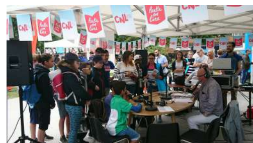
Radio du Livrodrome à Dunkerque le 10 juillet