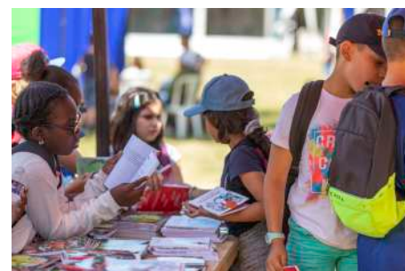
Parc d'attractions littéraires de La Courneuve